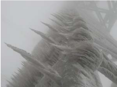
恐怖的电力铁塔厚冰

因雪成灾，更多的原因是人祸，是中共政权腐败吏治行动迟缓的又一佐证。但是，另一方面，在绝少下大雪的南方突然下起持续时间长、波及面积广、强度大、危害重的暴雪，应该说是极为罕见和反常的。虽然自 1999 年以来，旱灾、水灾、地震、蝗灾、沙尘暴、高温、赤潮等自然灾害并行或交替出现在中国的大地和海洋，但 08 年初的这场灾害就如 2003 年