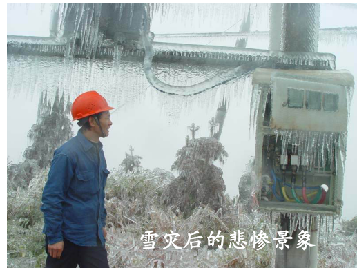
雪灾后的悲惨景象

今天的中国有多少罪恶正在发生？太多了！中共身先士卒、以身作则，带动着整个社会朝着邪恶堕落的方向沉沦。整个社会黑白颠倒，是非混淆，物欲横流，道德沦丧。中共在粉饰、掩盖，不管是历史的还是当下的罪恶中共都极力掩盖，为什么？因为它是中国一切罪恶之源！这一切都是拜它所赐！所以它也是中国一切灾难之源！