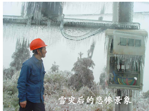
雪灾后的悲惨景象

今天的中国有多少罪恶正在发生？太多了！中共身先士卒、以身作则，带动着整个社会朝着邪恶堕落的方向沉沦。整个社会黑白颠倒，是非混淆，物欲横流，道德沦丧。中共在粉饰、掩盖，不管是历史的还是当下的罪恶中共都极力掩盖，为什么？因为它是中国一切罪恶之源！这一切都是拜它所赐！所以它也是中国一切灾难之源！