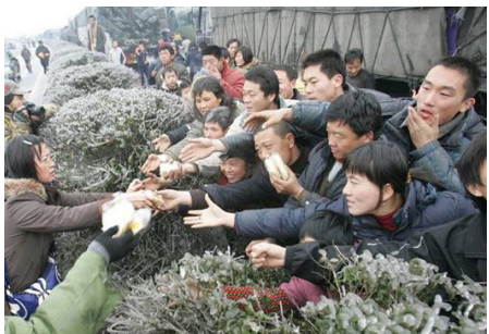
2.7 万辆车、8 万多名乘客和司机滞留在京珠高速公路湖南境内，有些乘客被困几天没吃东西。图为被困人群抢食品