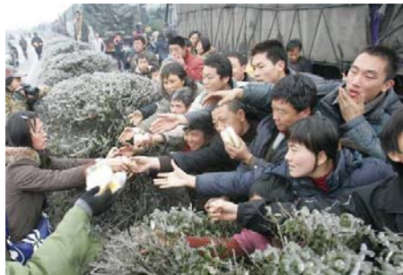
2.7 万辆车、8 万多名乘客和司机滞留在京珠高速公路湖南境内，有些乘客被困几天没吃东西。图为被困人群抢食品

大小媒体的报道讲的都是干部领导如何奔赴救灾第一线，而对于真实的灾情则避而不谈。民众