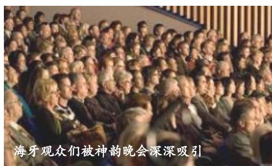
海牙观众们被神韵晚会深深吸引

当神韵晚会一开场“万王下世”大幕一拉开，就赢得全场观众的掌声，接下来的掌声响起在每一个表演节目的前后。