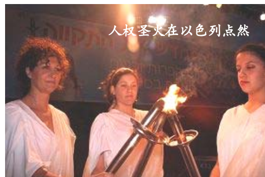
人权圣火在以色列点燃

二月十八日，全球传递的人权圣火到达以色列，并在特拉维夫市中心举行了火炬接力仪式。活动在以色列引起巨大社会反响及共鸣，全国性电视台、电台、报纸、网站等对活动进行了密集报导，各大宗教及种族领袖签订共同契约，要求中共立即