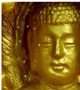
(韩国寺院中佛像脸上发现的婆罗花)

每一个善良的中国人，请珍重可贵的生命，切莫忽视上天给人类的警示，神佛慈悲救人，只见人心善念，神给人的机会是平等的。在天灭中共之前，退出中共党、团、队组织，这关系到您未来的生命，千万不要错过佛法救度的机缘。