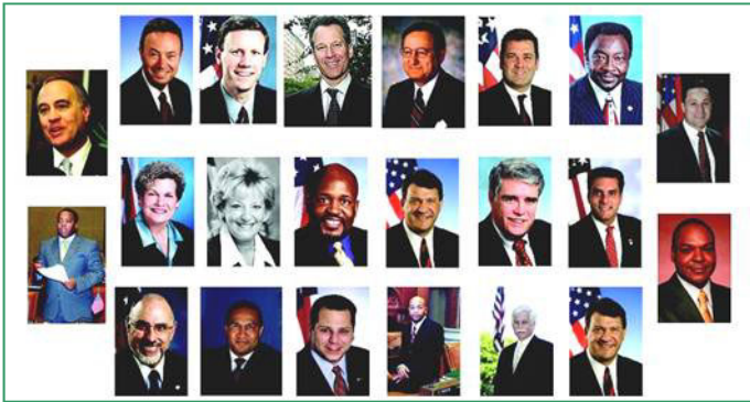
纽约七十多位政要（部份）预祝神韵演出圆满成功