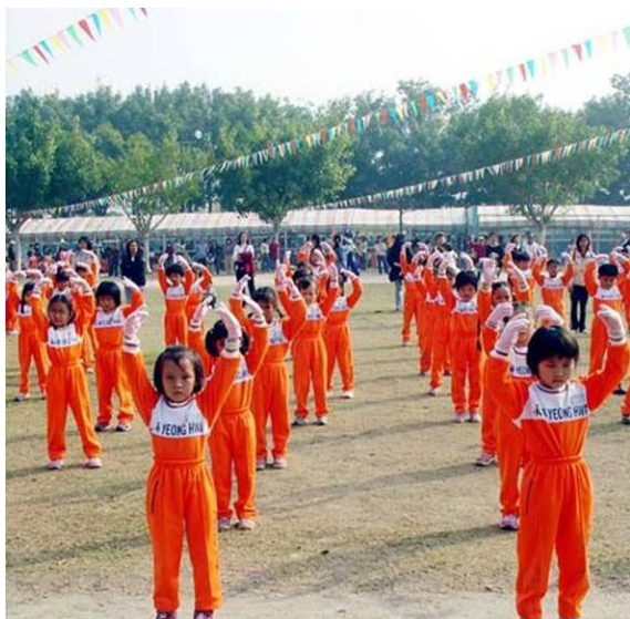
台北大法小弟子在有木国小校庆时集体炼功