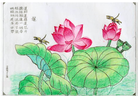
辽宁狱中大法弟子绘画《莲》

灌辣椒水，手指甲扎牙签，翻走的财物不给开票据。手段之残忍、性质之恶劣，与电视中日本人残害咱同胞没区别。什么是“正法”，什么是“邪法”，我内心深处有了质的改观。同样的一个法字，法度行为却不同。同样的“人类”，却执行着不同的行为。不难看出正、邪之分，谁正、谁邪。