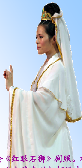
神韵晚会《红眼石狮》剧照。神告诉善良人大难来时如何逃生。