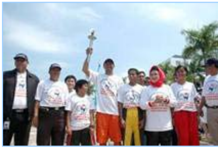
▲丽耀群岛长官夫人（右三）将人权圣火火焰交给田径队伍代表

法轮功受迫害真相联合调查团（CIPFG）发起的人权圣火在印尼的巡回传递活动于二零零八年一月四日起在首都雅加达展开之