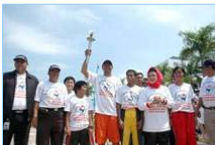
▲丽耀群岛长官夫人（右三）将人权圣火火焰交给田径队伍代表

法轮功受迫害真相联合调查团（CIPFG）发起的人权圣火在印尼的巡回传递活动于二零零八年一月四日起在首都雅加达展开之