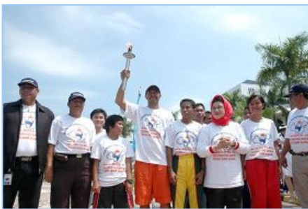
▲丽耀群岛长官夫人（右三）将人权圣火火焰交给田径队伍代表

【明慧网】 法轮功受迫害真相联合调查团（CIPFG）发起的人权圣火在印尼的巡回传递活动，于二零零八年一月四日起在首都雅加达展开。经过几个城市的传递，十三日抵达巴淡岛，在市政府中心举行交接仪式。