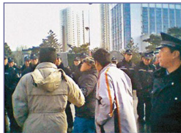
当局出动两万多名警察，围堵驱赶上访的蚂蚁养殖户。

二零零七年十一月二十日，辽宁省沈阳市爆发了大规模的群体性抗议事件。三万多人来到省政府，呼吁严惩非法集资的“蚁力神”集团。据有关部门初步统计，“蚁力神”集团至少骗取了一百二十多万蚂蚁委托养殖户的二百多亿资金，范围以辽宁为中心，辐射吉林、黑龙江、内蒙等地。