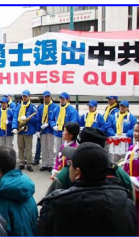
新年伊始，加拿大民众声援三千万中国人退出中共党、团、队。

其实法轮功学员所做的，就是象故事中的善心老人一样，告诉人们得救的真相。面对劝善，“信”，才有机会被拯救；顺应天意，才会得平安。