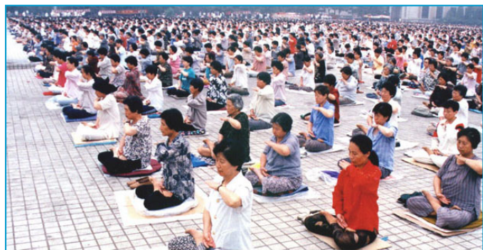
历史图片：九八年沈阳万名法轮功学员晨炼

依据法律，严肃地说，直到今天，炼法轮功在中国也完全是合法的。而对法轮功的镇压才是中共集团凌驾于法律之上的犯罪行为。