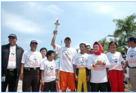
▲丽耀群岛长官夫人（右三）将人权圣火火焰交给田径队伍代表

【明慧网】 法轮功受迫害真相联合调查团（CIPFG）发起的人权圣火在印尼的巡回传递活动，于二零零八年一月四日起在首都雅加达展开。经过几个城市的传递，十三日抵达巴淡岛，在市政府中心举行交接仪式。