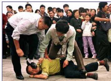
天安门便衣警察毒打上访、说明真相的法轮功学员

面对被骗得倾家荡产的养殖户，政府的答复是：不许闹事，否则怎么对付法轮功就怎么对待你们。