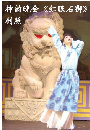
神韵晚会《红眼石狮》剧照