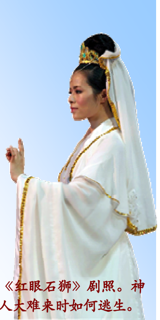
神韵晚会《红眼石狮》剧照。神告诉善良人大难来时如何逃生。