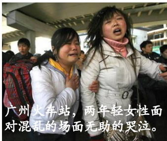
广州火车站,两年轻女性面对混乱的场面无助的哭泣。