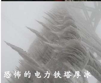
恐怖的电力铁塔厚冰