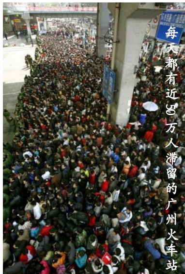
每天都有近四万人滞留的广州火车站