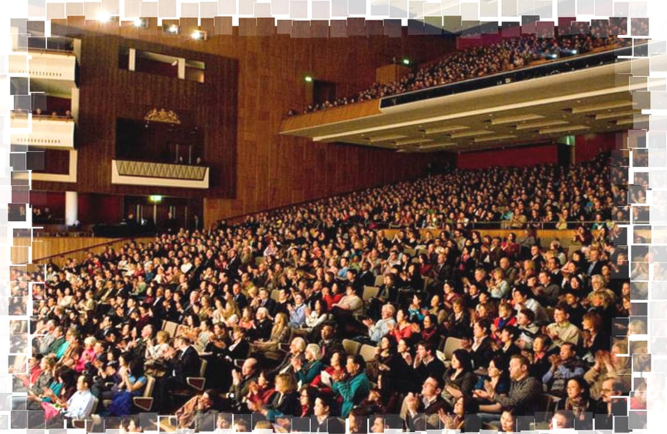
▲ 神韵晚会伦敦皇家节日音乐厅现场座无虚席