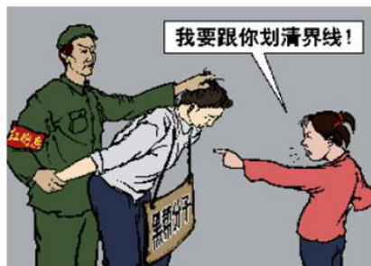
文革中父女反目成仇

【明慧网】最近教育部将在 10 省市中小学试点开设京剧课，但令人费解的是所规定的曲目中有 13 个选自“革命样板戏”。教育部此决定一经公布就引来了众多国内媒体、网友的非议。有的家长说：“一听到样板戏，就仿佛回到那个血腥的时代，大字报、批斗，让人不寒而栗，怎么能让孩子们再去学这样的东