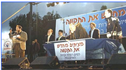
各宗教领袖吁中共停止反人类罪行

二月十八日，全球传递的人权圣火到达以色列，并在特拉维夫市中心举行了火炬接力仪式。活动