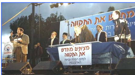
各宗教领袖吁中共停止反人类罪行

二月十八日，全球传递的人权圣火到达以色列，并在特拉维夫市中心举行了火炬接力仪式。活动