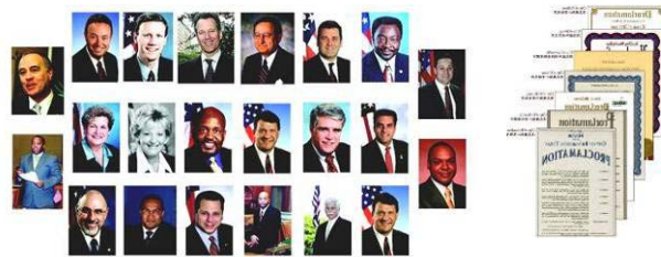
左：纽约七十多位政要为神韵发来贺信与褒奖。 右：美国德州十八位市长给神韵的嘉奖令。

西方人在观看后被中华神传文化博大精深的内涵所折服；海外华人看后更是激动不已，深感神韵复兴了中华文化，是所有华人的骄傲。