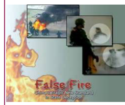
揭露自焚的影片《伪火》获第 51 届哥伦布国际电影节荣誉奖。