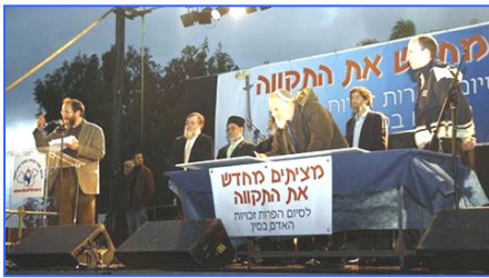
各宗教领袖吁中共停止反人类罪行

二月十八日，全球传递的人权圣火到达以色列，并在特拉维夫市中心举行了火炬接力仪式。活动在以色列