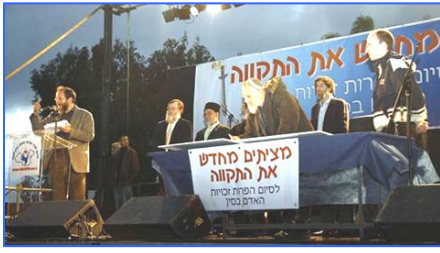
各宗教领袖吁中共停止反人类罪行

二月十八日，全球传递的人权圣火到达以色列，并在特拉维夫市中心举行了火炬接力仪式。活动在以色列