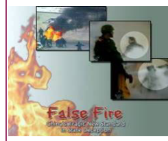
揭露自焚的影片《伪火》获第 51 届哥伦布国际电影节荣誉奖。