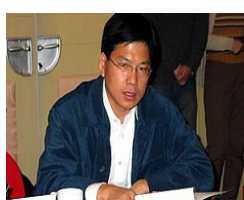
中国文化部刘军宁

2007年10月26日,安徽省政协常委汪兆钧发表四万字的致胡锦涛、温家宝公开信,信中呼吁: