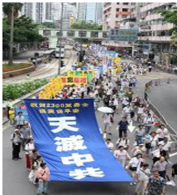
图为2007年7月1日,香港举行天灭中共大游行,声援2300多万中国人退出中共党团队。

“通过对中共残酷迫害并活摘法轮功学员人体器官牟利指控的调查,揭示法轮功学员在中国大陆遭受迫害的真相,制止迫害,并对策划和执行此种灭绝人性杀戮的参与者追究其国际刑事法上的「反人类罪」责任”。