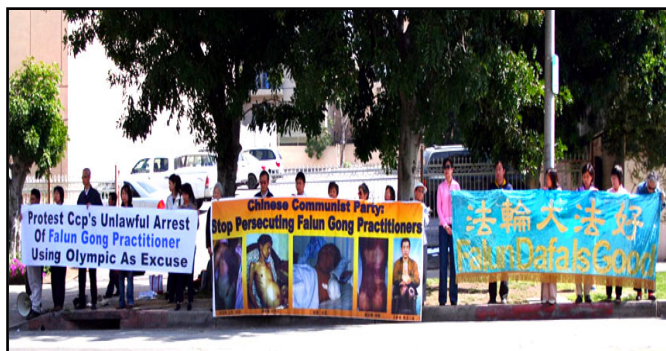
洛杉矶各界抗议中共借奥运加强迫害

【明慧网二零零八年三月十三日】自一九九九年七月二十日以来，中共对法轮功学员进行了群体灭绝性迫害，非法抓捕、关押、酷刑虐待，造成致伤、致残和致死情况的十分严重。二零零一年以来，中共获奥运举办权之后，不断加紧迫害。“追查国际”于二零零八年三月一日曾发表过“追查北京借奥运大批非法抓捕法轮功学员的紧急通告”。后经