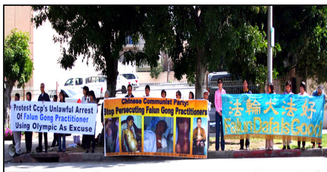
洛杉矶各界抗议中共借奥运加强迫害

【明慧网二零零八年三月十三日】自一九九九年七月二十日以来，中共对法轮功学员进行了群体灭绝性迫害，非法抓捕、关押、酷刑虐待，造成致伤、致残和致死情况的十分严重。二零零一年以来，中共获奥运举办权之后，不断加紧迫害。“追查国际”于二零零八年三月一日曾发表过“追查北京借奥运大批非法抓捕法轮功学员的紧急通告”。后经