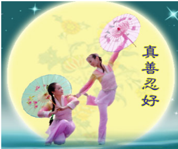
图：二零零六年新唐人电视台全球华人新年晚会舞蹈《飞天》

轻灵妙曼 旋转如风千紫散 摇曳多姿 弄影惊鸿美若诗 天国胜景 本性清明心为径 双手合十 唯愿苍生莫醒迟