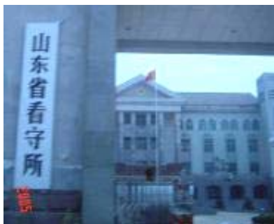
山东省看守所大门

这些得以曝光的迫害案例仅仅是济南市看（刘长山看守所）守所迫害善良无辜的冰山一角。