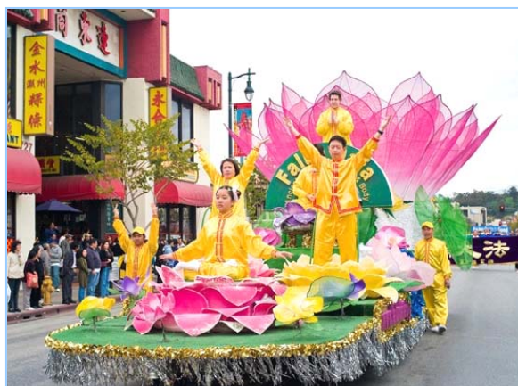
▲ 中西方法轮功学员在莲花车上展示法轮功的五套功法

在游行队伍中，特别令观众瞩目的是一群身穿白衣的法轮功女学员，每人手中捧着被中共迫害致死的法轮功学员的照片。从一九九九年七月中共迫害法轮功以来的八年多时间里，至少三千多位大陆法轮功学员因坚持“真、善、忍”的信仰，被中共