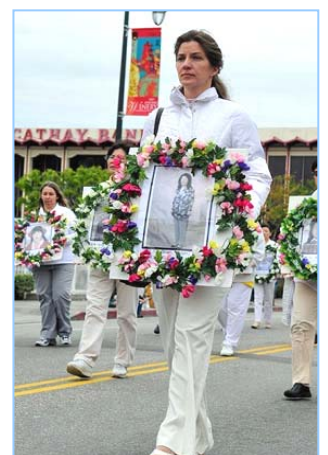
▲ 肃穆的气氛传递着大陆法轮功学员被迫害的真相

沿途，不少了解法轮功真相的中西方人士纷纷谈论：“是法轮功”，“啊！真、善、忍”。有的观众竖起大拇指，表达对法轮功学