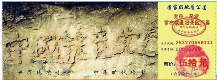
上图为掌布风景区门票上“中国共产党亡”的照片

一花，乃是佛经上记述的三千年一开的优昙婆罗花。当今频现世界各地，预兆转轮圣王下世度人。