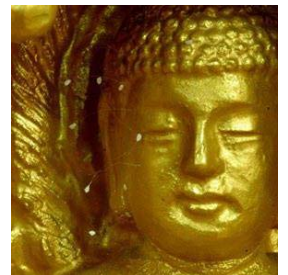
(韩国寺院中佛像脸上发现的婆罗花)