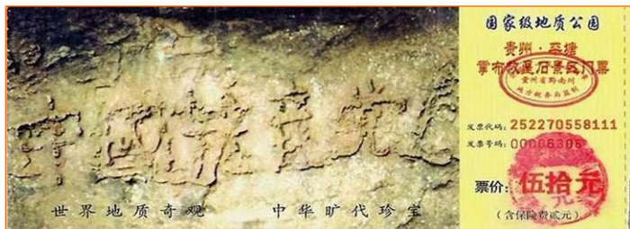
上图为掌布风景区门票上“中国共产党亡”的照片

一花，乃是佛经上记述的三千年一开的优昙婆罗花。当今频现世界各地，预兆转轮圣王下世度人。