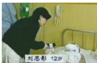
气管切开还能说、唱？记者采访不穿防护服，不戴口罩。