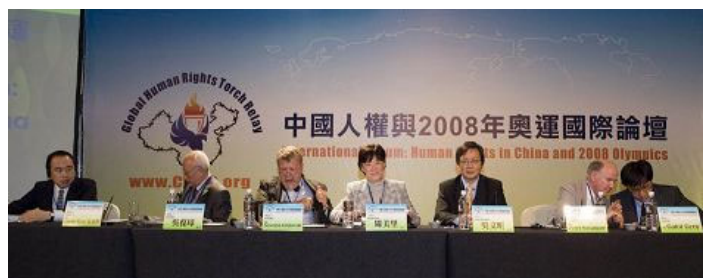
圆桌论坛讨论如何透过二零零八奥运促进中国人权的讨论

与会的国际人权专家和来自海外各国关怀人权的社会菁英纷纷揭露中共恶劣的人权纪录，为达成同样的世界，享有同样的人权，来自全球四大洲的政要、律师、学者和人权活动家在会中达成共识，宣布启动「人权圣火」进入中国大陆的传递计划，来回应中国人民「要人权、不要奥运」的呼声，以及呼吁立即制止中共人权迫害。