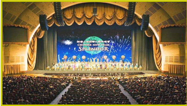
▲全球华人新年晚会纽约主场 15 场演出从1月30日至2月9日在无线电音乐城隆重上演，图为现场谢幕盛况。

由海外修炼法轮功的艺术家组成的“神韵艺术团”一年一度的“新唐人全球华人新年晚会”，自2006年开始在世界巡演以来，屡屡创下人文奇迹，引起全世界对中国正统文化的注目；展现出的中华民族文化的韵味和意境，具有完美的艺术造诣和极强的感召力，被誉为“世界顶级演出”；受到不同民族、国籍、文化背景的观众的广泛赞誉，好评如潮。