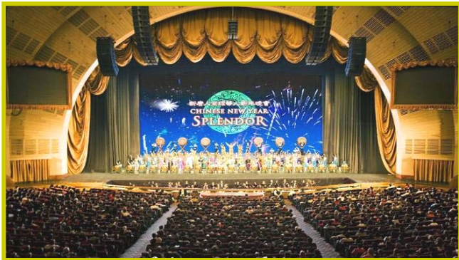
▲全球华人新年晚会纽约主场 15 场演出从1月30日至2月9日在无线电音乐城隆重上演，图为现场谢幕盛况。

由海外修炼法轮功的艺术家组成的“神韵艺术团”一年一度的“新唐人全球华人新年晚会”，自2006年开始在世界巡演以来，屡屡创下人文奇迹，引起全世界对中国正统文化的注目；展现出的中华民族文化的韵味和意境，具有完美的艺术造诣和极强的感召力，被誉为“世界顶级演出”；受到不同民族、国籍、文化背景的观众的广泛赞誉，好评如潮。