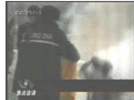
3、手摸被打后的头部