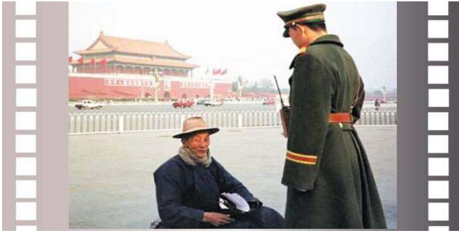
步行到天安门广场为法轮功和平请愿的老人