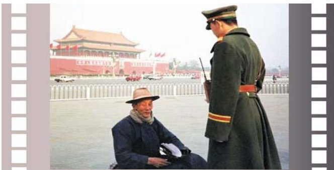
步行到天安门广场为法轮功和平请愿的老人