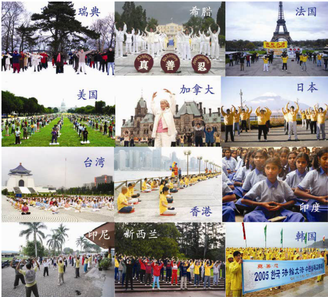
1995 年 3 月和 5 月，李洪志先生应邀到法国和

这些组织，抹去兽记！ 中国大陆绝大部分人都加入过共产党、共青团或少先队等组织。当“天要灭中共”时，这些人怎么办？那么神就要给人一个选择的机会。是抛弃邪恶、选择光明，还是做邪党的替罪羊、随着邪党下地狱，这难道不是关系到每个人的生死存亡的大事吗？