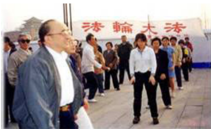
图为 98 年 5 月 15 日伍绍祖亲赴法轮功发祥地长春考察。

1998年5月15日，国家体育总局局长伍绍祖亲赴法轮大法发祥地长春考察。98年9月国家体总抽样调查法轮功修炼人12553人，疾病