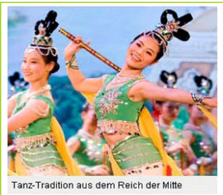
Tanz-Tradition aus dem Reich der Mitte

美国神韵艺术团三月十四到十六日在德国首都柏林连续演出四场，柏林观众热情高涨，对每一个节目都报以雷鸣般的掌声。演出结束，演员三次谢幕，观众起立长时间鼓掌，不愿离去。