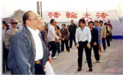
图为 98 年 5 月 15 日伍绍祖亲赴法轮功发祥地长春考察。

1998年5月15日，国家体育总局局长伍绍祖亲赴法轮大法发祥地长春考察。98年9月国家体总抽样调查法轮功修炼人12553人，疾病