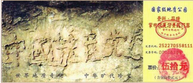
▲掌布风景区门票上“中国共产党亡”的照片

古今中外有许多预言，如：中国的《推背图》、《烧饼歌》、《梅花诗》及《马前课》等；西方的《圣经启示录》等，都惊人一致地预言这几年中共要灭亡，还记载着天灭中共时其追随者被一同诛灭的可怕惨景。