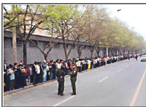
▲上访学员安静祥和，警察闲聊天

【明慧网】一九九九年四月二十五日，逾万名法轮功学员，出于对政府的信任，依法前往位于北京府右街的国务院信访办公室（位于中南海西门）和平上访，反映天津的法轮功学员被执法部门无端