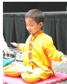
▲海外法轮功小学员在炼功

（接上页）孩子上初中时，大法开启了他的智慧，电脑中及附属设备，包括移动硬盘、mp3 等等他都会操作和维修。二零零四年，孩子顺利的考入了省重点中学，去年又成功的考入了自己理想的名牌大学。我儿子现在多才多艺，一米八二的个子，长的特帅，是出了名的帅哥，从里到外透着法轮功学员的正直、慈悲、洒脱。◇