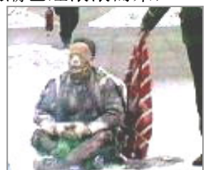
自焚者王进东两腿之间有个烧不坏的雪碧瓶。

可贵的朋友，人的生命只有一次，请快来了解真相！快快废除那恶毒的誓约，为自己迎来崭新的明天！◇