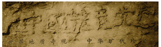
（贵州省平塘县掌布乡“藏字石”风景区门票图案）

据中央电视台报道：2002 年 6 月，贵州省平塘县掌布乡亿年“藏字石”崩裂惊现：“中国共产党”！（实际上，是六个大字：“中国共产党亡”。）