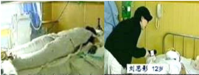
央视《焦点访谈》中的“自焚者”被包裹得严密。