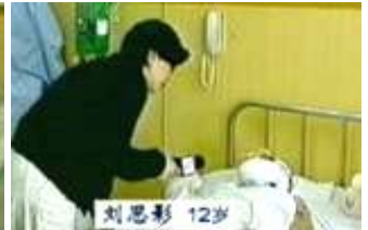
气管切开还能说唱？记者采访 不穿防护服不戴口罩。