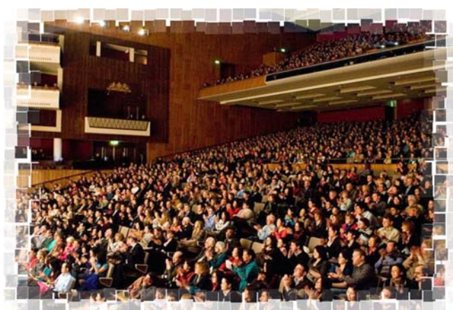
▲ 神韵晚会伦敦皇家节日音乐厅现场座无虚席

由美国神韵艺术团担纲的神韵晚会，自 2008 年 1 月初在美国纽约拉开序幕后，兵分两路，先后来到德国、荷兰、日本、韩国、英国、比利时、法国、瑞士、奥地利、台湾等国家和地区的政治、经济、文化中心进行巡回演出。晚会将中华五千年传统文化中的精粹，以近乎完美的艺术手段展现在众多观众面前，让观众在历史的长卷中感受着人类曾经的辉煌，感受着最正统的中华文化，感受着真正的艺术之美。