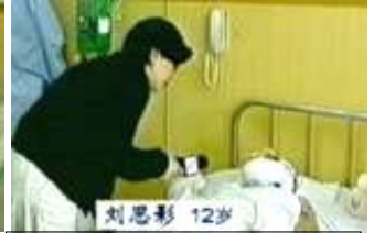
气管切开还能说唱？记者采访 不穿防护服不戴口罩。