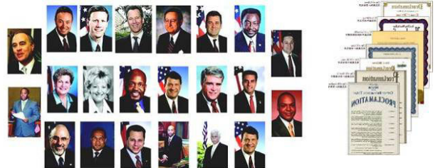
左：纽约七十多位政要为神韵发来贺信与褒奖。 右：美国德州十八位市长给神韵的嘉奖令。