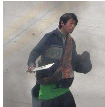
泰国华侨见证中共警察扮演藏人持刀施暴。

有报道说，西藏事件的导火索是中共派遣了一伙暴徒混在藏民中率先砸抢超市、焚毁商店汽车，