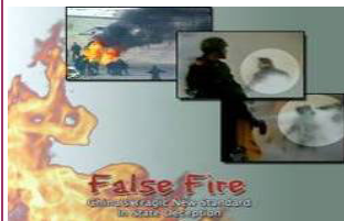
揭露自焚的影片《伪火》获第51届哥伦比亚国际电影节荣誉奖。