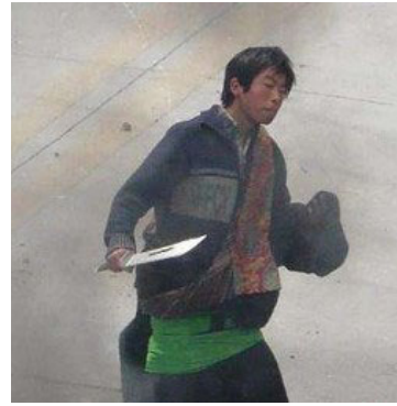
泰国华侨见证中共警察扮演藏人持刀施暴。

有报道说，西藏事件的导火索是中共派遣了一伙暴徒混在藏民中率先砸抢超市、焚毁商店汽车，