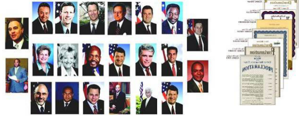
左：纽约七十多位政要为神韵发来贺信与褒奖。 右：美国德州十八位市长给神韵的嘉奖令。