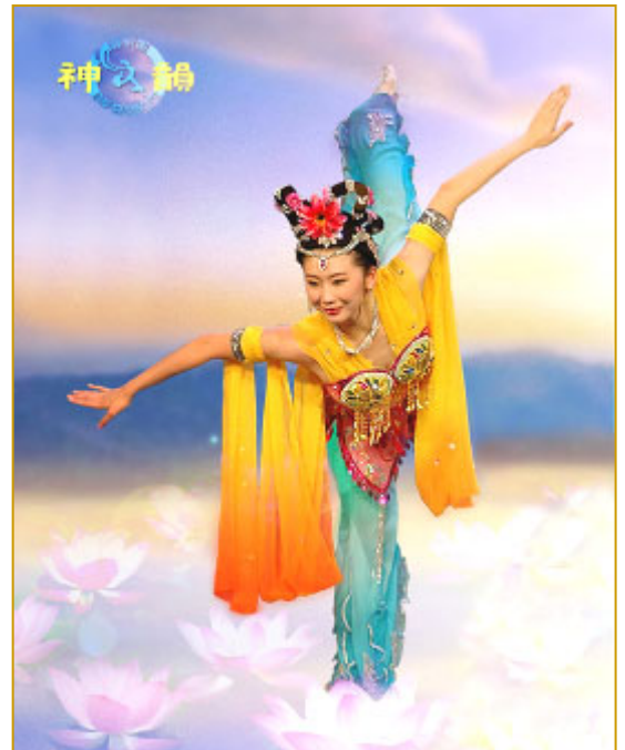
穿越人间天上 再现中华神韵