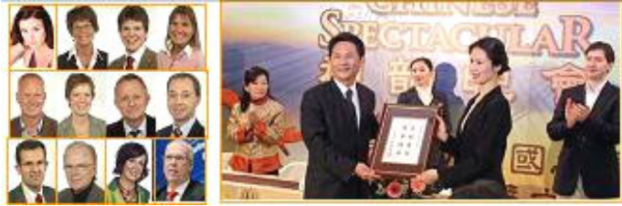
▲瑞典各党派政要致贺词,迎神韵。 ▲台南市政府褒奖神韵纽约艺术团：正统艺术，纯善纯美。

《柏林报》用“最美的中国人从纽约来”为题，宣告神韵的到来。报导说：“一些居住在美国的华人，立志维护被共产党摧毁的中国传统文化，并将其展现给世人。四年前，他们成立了艺术团，到世界各地巡回演出。”