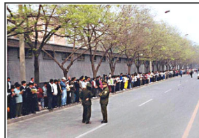
▲上访学员安静祥和，警察闲聊天

【明慧网】一九九九年四月二十五日，逾万名法轮功学员，出于对政府的信任，依法前往位于北京府右街的国务院信访办公室（位于中南海西门）和平上访，反映天津的法轮功学员被执法部门无端