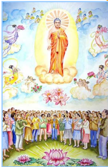
▲ 以色列大法弟子的画

五月十三日,是“世界法轮大法日”。十六年前的这一天,法轮大法在中国大陆公开传出。至今,大法已洪传世界八十多个国家,“真善忍”的修炼使上亿人达到了身体健康、道德升华。每年的这一天,各国法轮功学员都会举行庆祝活动,和当地的善良民众们一起,欢庆这个伟大节日。