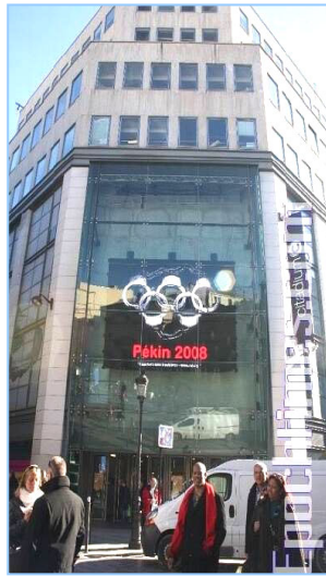
巴黎 Citadium 商店的户外电子屏显示出“记者无疆界”设计的著名标志：北京 2008 手铐五环奥运图

用“奥运”和“政治任务”上网查询，真是全国一盘棋，处处都把奥运当作中心工作的政治任务。不但北京天津和各个省市要把奥运当作“重要光荣”“当前压倒一切”的政治任务，也就是参加志愿服务，给奥运会送花，开播高清晰度电视节目，市容环境卫生，出