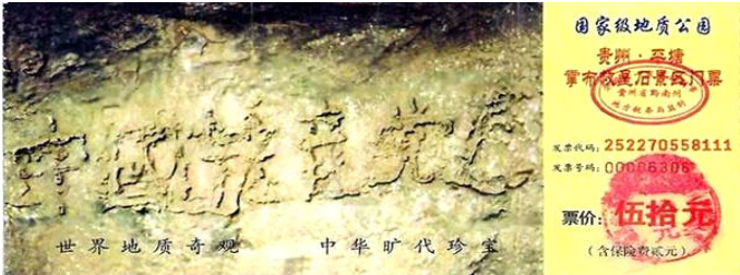
图为藏字石风景区门票：“中国共产党亡”清晰可见

秦始皇以为“亡秦者，胡也”的“胡”是胡人，而不料恰恰是他的儿子胡亥。真是人算不如天算，预言就这样成真了。如果读者感兴趣，可以参照《史记·秦始皇本纪》。