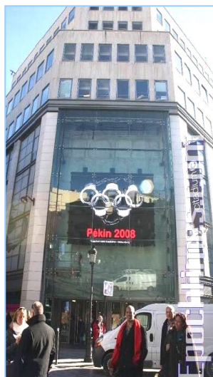
巴黎 Citadium 商店的户外电子屏显示出“记者无疆界”设计的著名标志：北京 2008 手铐五环奥运图

用“奥运”和“政治任务”上网查询，真是全国一盘棋，处处都把奥运当作中心工作的政治任务。不但北京天津和各个省市要把奥运当作“重要光荣”“当前压倒一切”的政治任务，也就是参加志愿服务，给奥运会送花，开播高清晰度电视节目，市容环境卫生，出