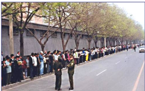
▲四.二五上访现场，法轮功学员文明安静，警察不用维持秩序，在一旁聊天。学员背后不是中南海红墙，所谓的“围攻中南海”根本不存在。