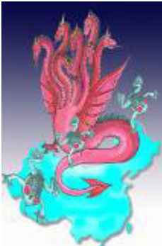
圣经启示录描述一条“大红(赤)龙，七头十角，七头上戴着七个冠冕

《圣经启示录》预言“最后的审判”到来时，淘汰所有印上兽记的人。那么曾经加入过党团队的人要避过这场灾难，唯一的办法就是退出中共的这些组织，抹去兽记！