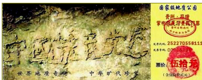
图为藏字石风景区门票：“中国共产党亡”清晰可见

万年前生成、五百年前从山上滚下裂开的，系天然形成。可见上天早已注定了中共走向灭亡的命运！