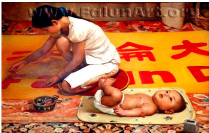
油画 缝制“法轮大法好”《横幅》