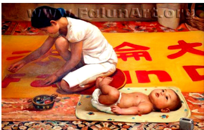
油画 缝制“法轮大法好”《横幅》

加入共产党的每一个人，无论是年轻人还是老年人，在每一个共产党统治的国家，不管是中国、俄国、东欧还是南美，只要是共产党所到之处，和平和正义都不复存在。我鼓励你们，不要被愚弄，表态吧，退出中共！”◇