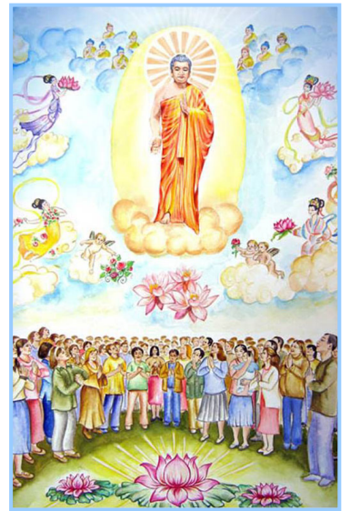
▲ 以色列大法弟子的画

五月十三日，是“世界法轮大法日”。十六年前的这一天，法轮大法在中国大陆公开传出。至今，大法已洪传世界八十多个国家，“真善忍”的修炼使上亿人达到了身体健康、道德升华。每年的这一天，各国法轮功学员都会举行庆祝活动，和当地的善良民众们一起，欢庆这个伟大节日。