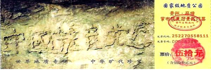
图为藏字石风景区门票：“中国共产党亡”清晰可见

读历史，便联想到现实，古代有预言，现代一样也有。零二年六月“藏字石”在贵州省平塘县掌布乡被发现，巨石上清晰可见“中国共产党亡”六个横排大字。据专家考证“藏字石”形成于两亿多年前，绝无任何人工雕琢、塑造、粘贴的痕迹。“藏字石”上的“中国共产党亡”，正是上天对人明示中共必将灭亡。◇