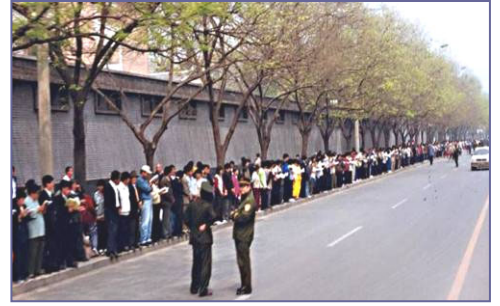
▲四·二五上访现场，法轮功学员文明安静，警察不用维持秩序，在一旁聊天。学员背后不是中南海红墙，所谓的“围攻中南海”根本不存在。

一九九九年四月二十三日，天津市公安局殴打和非法逮捕当地法轮功学员。学员在天津市政府被告知，公安部介入了此事，你们去北京才能解决问题。