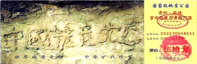
图为藏字石风景区门票：“中国共产党亡”清晰可见

读历史，便联想到现实，古代有预言，现代一样也有。零二年六月“藏字石”在贵州省平塘县掌布乡被发现，巨石上清晰可见“中国共产党亡”六个横排大字。据专家考证“藏字石”形成于两亿多年前，绝无任何人工雕琢、塑造、粘贴的痕迹。“藏字石”上的“中国共产党亡”，正是上天对人明示中共必将灭亡。◇