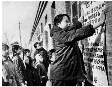
“文革”中小学生也贴大字报

中共从俄罗斯请来的所谓专家提出了几个邪教的特征，可笑的是人们发现中共是最符合这几大特征的组织。