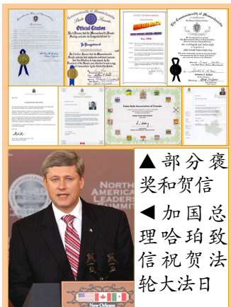
▲部分褒奖和贺信 ▲加国总理哈珀致信祝贺法轮大法日

【明慧网】二零零八年五月十三日“世界法轮大法日”来临之际，美国、加拿大政要纷纷发来褒奖或贺信，祝贺法轮大法传世十六周年。