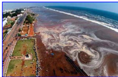
2004年印度洋海啸，30多万人丧生。海啸来临前，很多游客认为当地人的提醒扫了他们游玩的兴致。