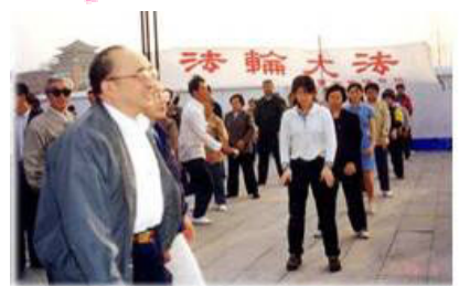
图为 98 年 5 月 15 日伍绍祖亲赴法轮功发祥地长春考察。

1998 年 5 月 15 日，国家体育总局局长伍绍祖亲赴法轮大法发祥地长春考察。98 年 9 月国家体总抽样调查法轮功修炼人 12553 人，疾病痊愈和基本康复率为 77.5%，加上好转者人数 20.4%，祛病健身总数有效率高达 97.9%。平均每人每年节约医药费 1700 多元，每年共节约医药费 2100 多万元。