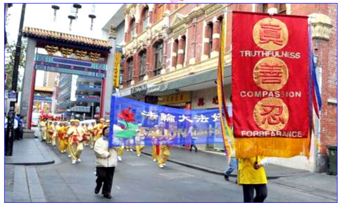
图：澳洲法轮功学员庆祝二零零八年世界法轮大法日

美国麻州众议院的褒奖决议中写道：法轮大法是一个基于宇宙特性“真、善、忍”的古老修炼方法，包括一套能达到自身改善的动功和静功（打坐）。修炼