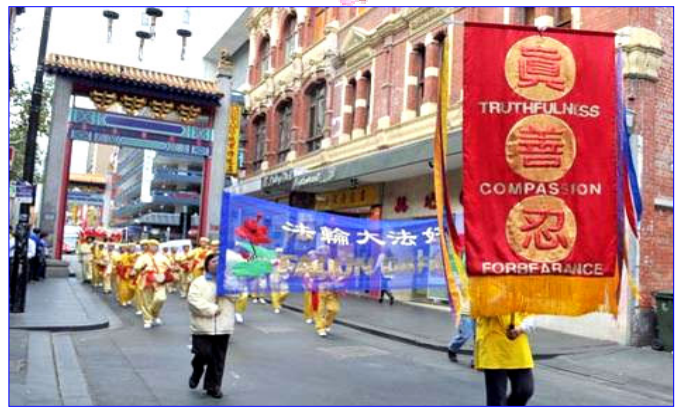
图：澳洲法轮功学员庆祝二零零八年世界法轮大法日

美国纽约、华盛顿 DC、旧金山、休士顿、费城、亚特兰大、西雅图等地，加拿大、德国、日本、澳大利亚、新西兰、新加坡、马来西亚、泰国等国都举行了庆祝活动，欢庆第九届“世界法轮大法日”。