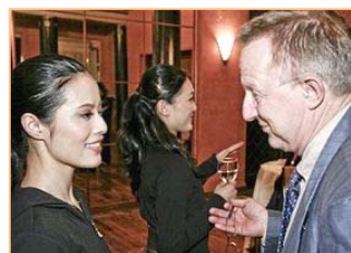
▲多位瑞典政要在本国观看了神韵演出，国会议员斯特凡·丹尼逊表示，演出汇集了中国传统精华。图为他与神韵演员交谈。