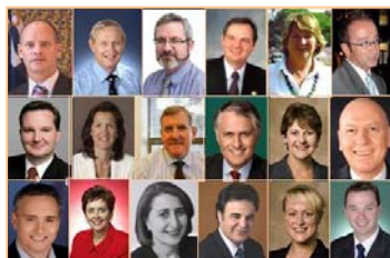
▲神韵晚会为澳洲观众带来了中华传统文化的纯善纯美。澳大利亚六十多位政要致信欢迎神韵纽约艺术团到来，并祝贺演出圆满成功。