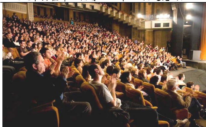
▲零八年四月八日晚，神韵巡回艺术团在罗马尼亚布加勒斯特国家大剧院的演出盛况空前，各界一致赞誉。