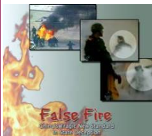
揭露自焚的影片《伪火》获第 51 届哥伦比亚国际电影节荣誉奖。