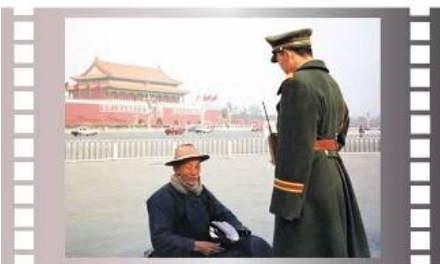
▲美联社图片：步行到天安门广场为法轮功和平请愿的老人

区，将“真善忍”的美好带给全人类，获得各国的褒奖与支持议案、信函已超过2900项，法轮功创始人更是自2000年起连续4度获诺贝尔和平奖提名。这些事实不值得你们深思吗？别忘记，中共在历次运动中都是卸磨杀驴。不管我们承受的是怎样的深重痛苦，那只是暂时的，你们是否有想过你们的将来？