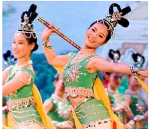
Tanz-Tradition aus dem Reich der Mitte

送您一句真言 为您生命永远 愿您明白真相 全家幸福平安 “ 法轮大法好 真善忍好 ”