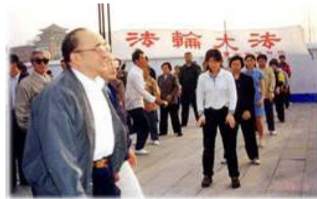
图为98年5月15日伍绍祖亲赴法轮功发祥地长春考察。

1998年5月15日，国家体育总局局长伍绍祖亲赴法轮大法发祥地长春考察。98年9月国家体总抽样调查法轮功修炼人12553人，疾病痊愈和基本康复率为77.5%，加上好转者人数20.4%，祛病健身总数有效率高达97.9%。平均每人每年节约医药费1700多元，每年共节约医药费2100多万元。