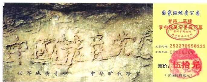
贵州省平塘县掌布乡“藏字石”风景区门票图案

由此我想到了以前看过一张门票，上面印着一个带字的石头。那是贵州省平塘县掌布乡“藏字石”风景区的门票（下图），门票上的图片是二零零二年六月在掌布乡发现的距今二亿七千万年的“藏字石”，五百年前崩裂的巨石断面内有六个大字：中国共产党亡。此奇观被一百多家报纸、电视、网站报道，只不过没人敢提那个“亡”字，但每一个亲眼见到的人都心知肚明。看到这张门票时我就在想：这不是老天说话了吗？那么今天盛传的“天灭中共，退党保命”不就是老天要传达给人的信息吗？不管通过谁的口传达，都是在传达天意，人只有遵从天意才明智。