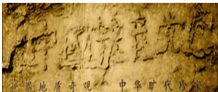
贵州平塘亿年藏字石 天灭中共奇石现 三退保命莫迟延

退党潮势如破竹。《九评》发表后一个月內就通过网路、电话、传真、电视插播、户外张贴、人传人等多种方式传遍了大陆各大城市。动态网统计数字显示，2005年3月以来，中国大陆平均每天有3~6万多人突破中共恶党的网络封锁在海外大纪元网站声明，退出中共党、团、队，其中包括中共党政军高层内的党员。从大纪元2004年12月3日开设“退党”网站以来，至2008年5月9日，退党(团、队)人数已经超过3640万。