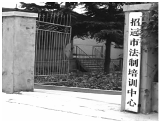
法轮功学员被关押在一层

2001年它组建了非法关押、迫害法轮功学员的黑窝——玲南金矿洗脑班。因为迫害法轮功学员，该黑窝招来天惩——火灾，损失惨重。为了掩盖，今年他们把黑窝的里里外外都装修了一番，还在室外设置了健身器材，室内设了一个加工厂，摆放了几个绣花的撑子，做样子，说是为“转化”了的学员回家“发家致富”提供条件。