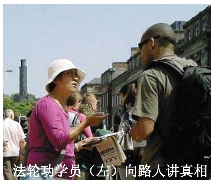
法轮功学员（左）向路人讲真相

学员们摆好了曝光中共残酷迫害的图片、展现大法真相的照片、中英文《九评共产党》光盘，呼