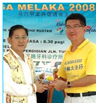
▲主办方给参赛的法轮功学员代表（右）颁奖

【明慧网】马来西亚“马六甲龙舟金杯锦标赛”于二零零八年六月一日在马六甲河畔举行，当地法轮功学员组成女子队和男子队参加了这项传统文化活动，并分别获得精神奖和纪念奖。主办单位特别安排新加坡法轮功学员组成的腰鼓队表演中华传统腰鼓舞，令龙舟赛更添欢乐气氛。