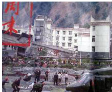
倒塌的中学后面露出坚固豪华的办公楼

五月十四日，中央电视台 CCTV9 频道英语节目有一个讨论“汶川五一二大地震”的嘉宾访谈节目，在谈到“汶川地震造成如此巨大伤亡是否有个责任问题”时，中国地球物理学会天灾预测专业委员会顾问陈一文先生通过电话用英语回答：从二零零六年三年来，天灾预测专业委员会就汶川地区可能发生强震，曾经向中国地震局提出过三次中期预测，特别是二零零八年五月三日，陈一文亲手向中国地震局发了一份汶川地区可能发生强震的预报。