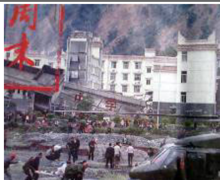
倒塌的中学后面露出坚固豪华的办公楼

近日来，全国各地民众纷纷要求追查地震预报事件。很多民众都反映，当地的政府部门和军工企业损失很小，人员都在地震发生前被告知预防地震。