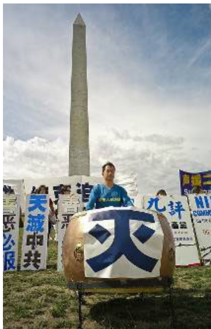
退党集会一贯打鼓 寓意镇邪灭乱

吉祥平安鼓、丰收鼓还有战鼓，宫廷有宫廷的鼓，如皮鼓等，民间有民间的鼓，如腰鼓最为常见。总之，鼓的种类繁多，在民间的运用随处可见。