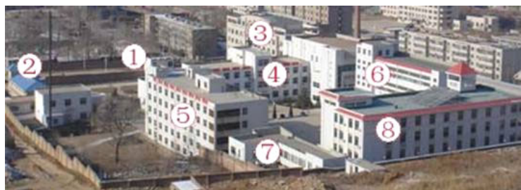
山东第一女子劳教所示意图

◆ 山东第一女子劳教所 （即 济南浆水泉女子劳教所 ）位于 济南市历下区浆水泉路 20 号 ，是迫害 山东省女法轮功学员 的黑窝，目前仍非法关押着很多来自 山东各地及外省份的女法轮功学员 。